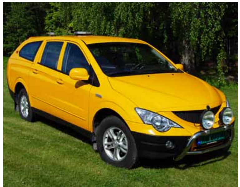
vi skiftet ut målebil nr. 2 for fotografering av vegger. Den nye bilen er også montert med to kamera.